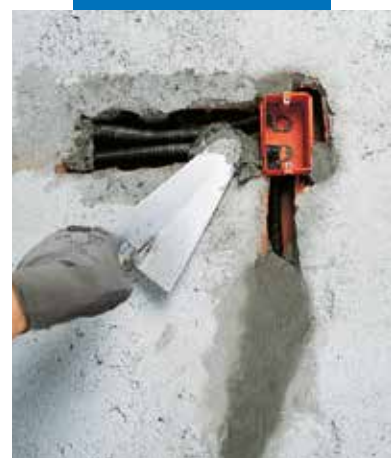
Elektros lizdų ir laidų užtaisymas naudojant Lampocem