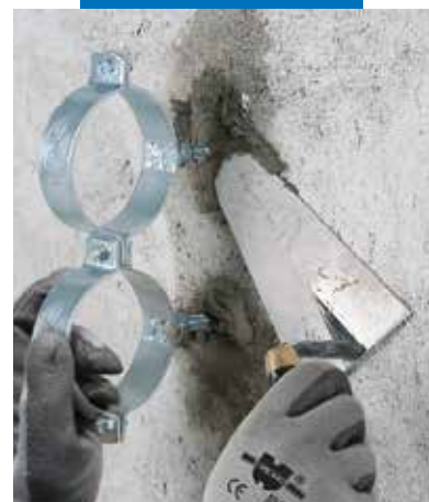
Vamzdžių laikiklių tvirtinimas ir įrengimas naudojant Lampocem