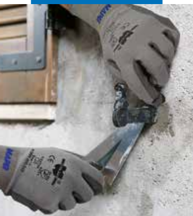
Langų vėrų tvirtinimo remontas naudojant Lampocem

negali būti nereikalingų ir palaidų medžiagų, and degraded or loose material.