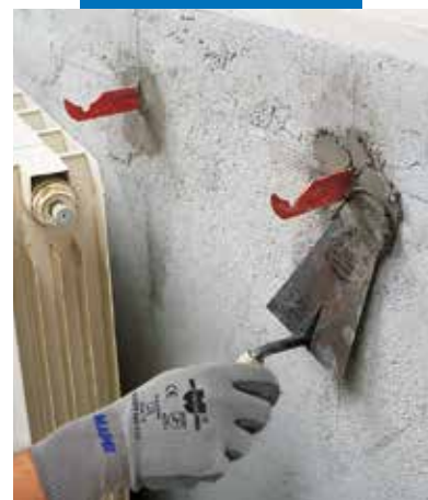
Radiatorių tvirtinimo elementų remontas naudojant Lampocem