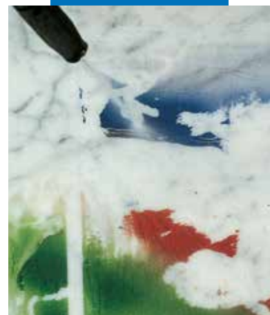
Carrara marmuro, apsaugoto WallGard Graffiti Barrier, valymas naudojant aukšto slėgio vandens srovę