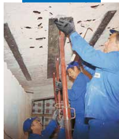
Metalinių/ plieninių stiprinimo juostų klijavimas ant laikanciųjų konstrukcijų