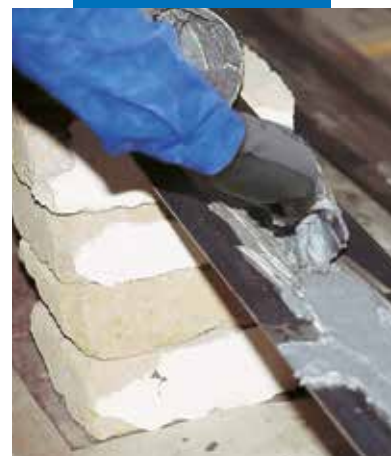
Adesilex PG1 užtepimas ant plieninės juostos