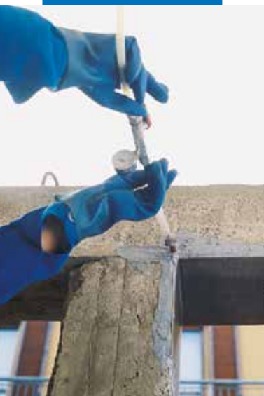
Kolona apdorota Adesilex PG1