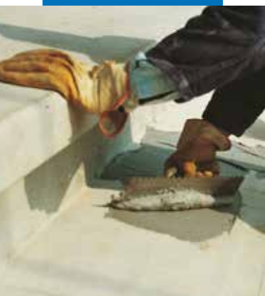
Gelžbetoninių surenkamų laiptų pakopų tvirtinimas tepant Adesilex PG1 dantyta mentele