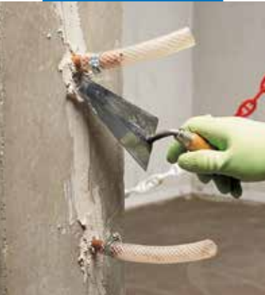
Injektavimo vamzdelių fiksavimas ir plyšių užtaisymas