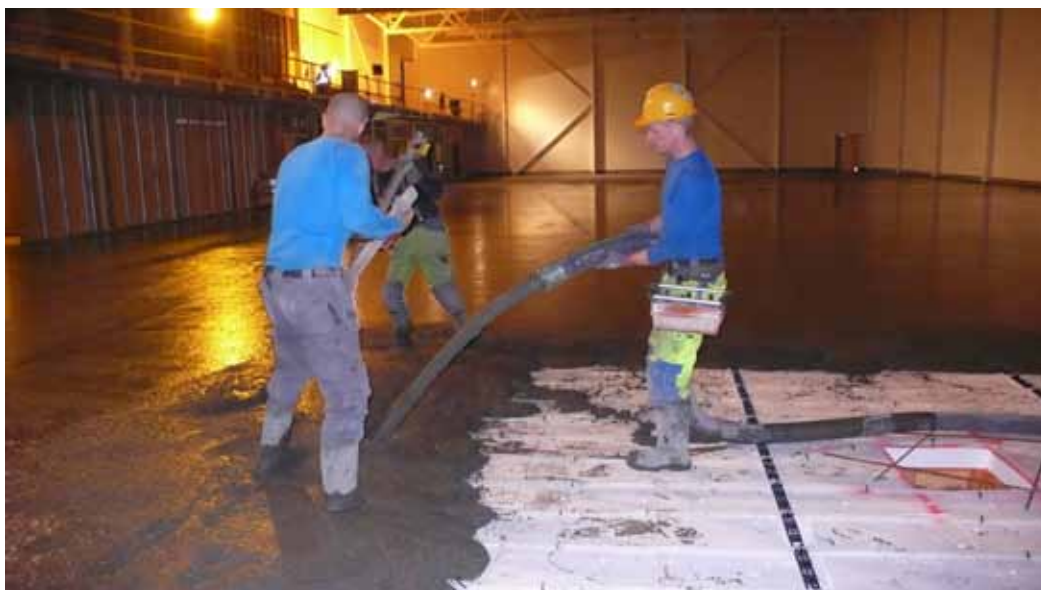
1 nuotrauka: liejamos besiulės „Mapecrete System“ grindys, 1300 m 2 .

Visa trūkstanta informacija apie produktą galima pagal užklausimą ir www.mapei.com