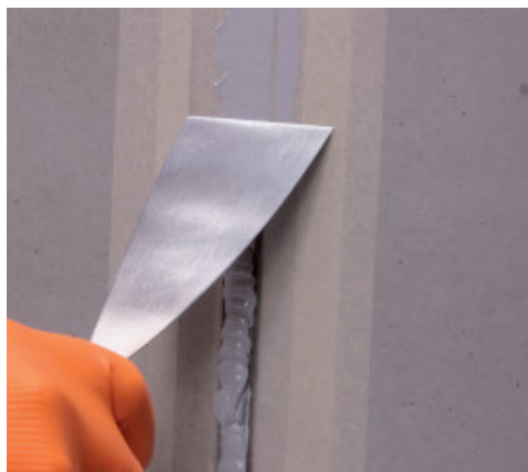
Mapeflex PU40 išlyginimas