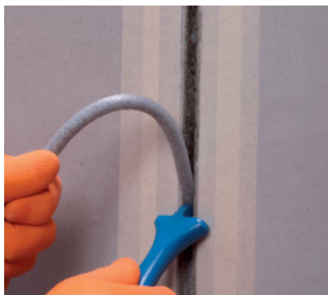
Juostos Mapefoam įrengimas siūlėje