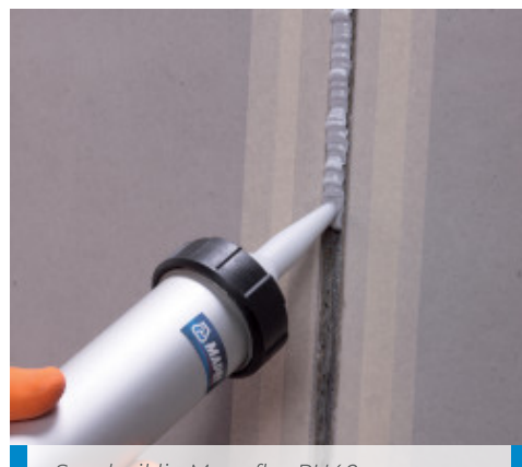
Sandariklio Mapeflex PU40 naudojimas