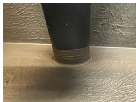
Ant Mapeguard PC manžeto užtepta Mapeguard WP 2K Membrane