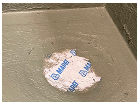
Vamzdžiams sandarinti naudojamas Mapeband B DC. Prieš uždedant prispaudžiamąjį žiedą, manžeto dalis iš tekstilės uždengiama membrana