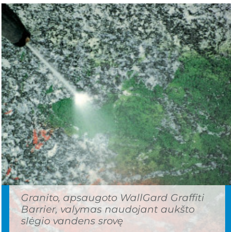
Granito, apsaugoto WallGard Graffiti Barrier , valymas naudojant aukšto slėgio vandens srovę

Po graffiti valymo aukšto slėgio vandens srove, atnaujinkite fasado apsaugą iš naujo užtepdami sluoksnį WallGard Graffiti Barrier .