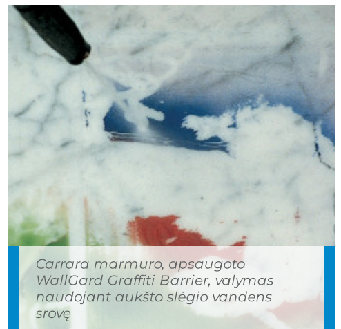
Carrara marmuro, apsaugoto WallGard Graffiti Barrier , valymas naudojant aukšto slėgio vandens srovę