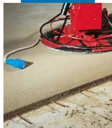
Galutinis Topcem lyginimas