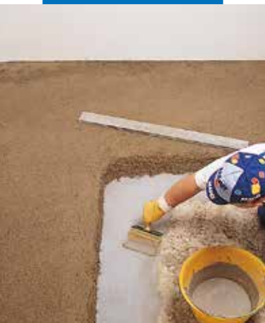
Viršutinio Topcem sluoksnio išlyginimas

Bet koks šiame techniniame duomenų lapė esančių tekstų, nuotraukų ar iliustracijų pasikeičimas ar reprodukcija yra draudžiama, o pažeidėjas gali būti patrauktas baudžiamojon atsakomybėn.