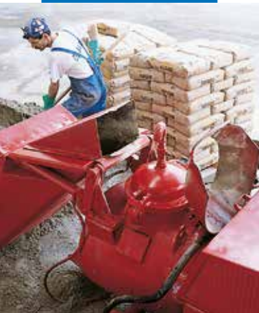
Topcem maišymas su automatinio pumpavimo įrenginiu