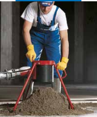
Topcem mišinio paskirstymas ant paviršiaus