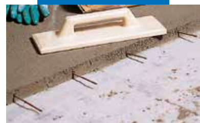
Armutas Topcem išlyginamasis sluoksnis