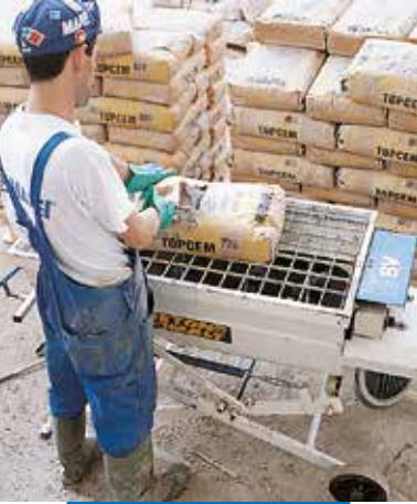
Topcem maišymas mini-barteryje