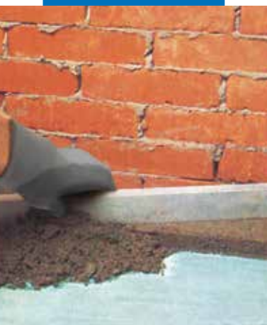
Išlyginamasis sluoksnis su Planicrete