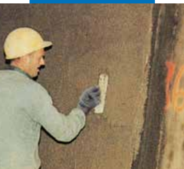
Cementinis tinkas su Planicrete – Ville Marie, Monrealis, Kanada

Visa trūkstama informacija apie produktą galima pagal užklausimą ir www.mapei.no