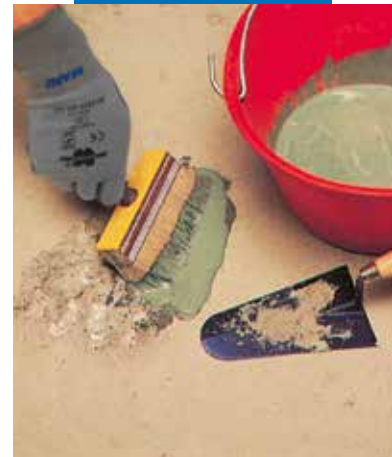
Grindų remontas: mišinio naudojimas

Nors techninė informacija ir rekomendacijos šiame produkto duomenų lape yra pateiktos pagal geriausius turimus mūsų duomenis ir patirtį, bet kuriuo atveju visą aukščiau pateiktą informaciją reikia vertinti kaip rekomendacinę ir įsitikinti jos tikslumu