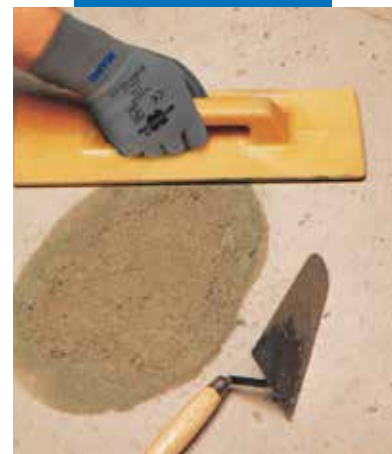
Grindų remontas: galutinis lyginimas