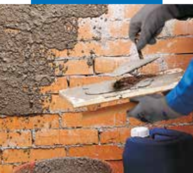
Tinkavimo mišiniai su Planicrete

PASTABA: Planicrete skiedimo su vandeniu santykiai yra duoti sausiams užpildams. Jeigu užpildai drėgni, Planicrete kiekis mišinyje turėtų būti mažinamas.