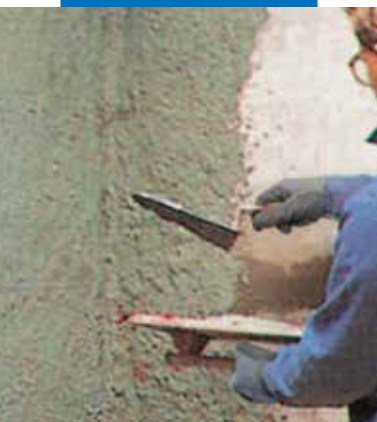
Tinkavimo klijai su Planicrete