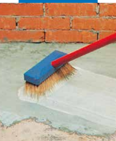
Skiedinio su Planicrete užtepimas ant pagrindo