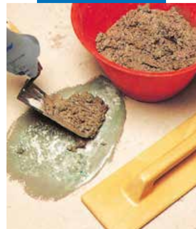
Grindų remontas: skiedinio naudojimas