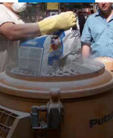
Ultratop maišymas su maišykle

kokia kita danga gali būti įrengiama po trumpo laiko.