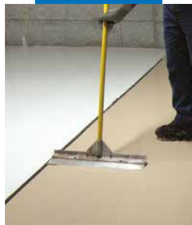
Ultratop lyginimas iškart po pylimo