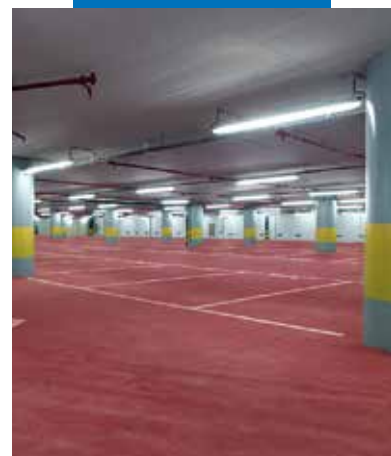
Grindys įrengtos naudojant raudoną Ultratop. Berlaymont'o pastatas, Briuselis