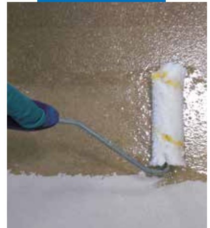
“Terrazzo alla veneziana” effect. Application of Mapefloor I 910