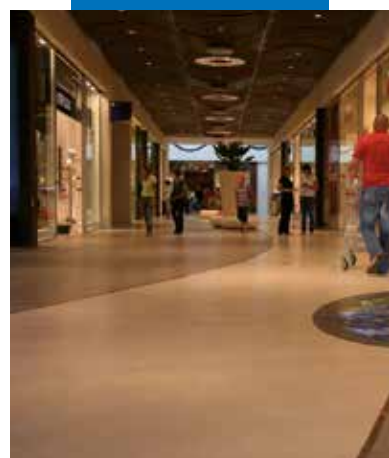
Galutinis grindų, įrengtų su Ultratop, vaizdas

* Testas atliekamas su viršutine Mapefloor Finish serijos danga