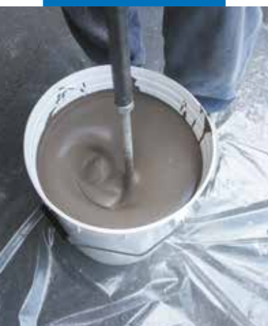
Produkto paruošimas su maišykle