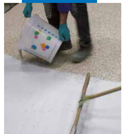
Ultratop panaudojimas ant sukietėjusio paviršiaus iš natūralaus užpildo + Mapefloor I 910