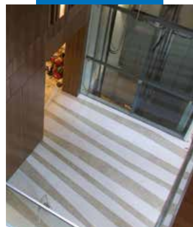
Viešbučio dizainas - Budapeštas - Vengrija. "Terazzo alla veneziana" efektas