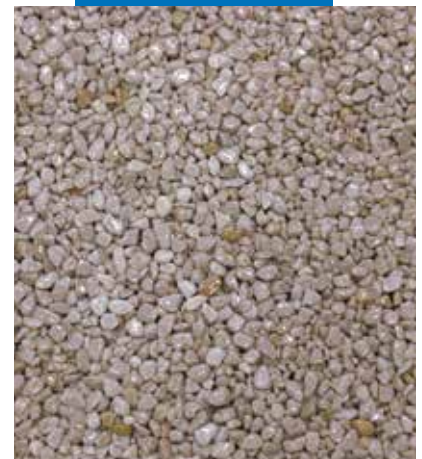
Natūralaus užpildo + Mapefloor I 910 panaudojimas