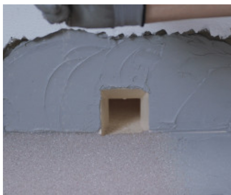
Vamzdžių hidroizoliacija iš priekio