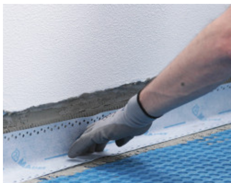
Hidroizoliacija per visą perimetrą su Mapeband Easy juosta, priklijuota su Mapeguard WP Adhesive klijais