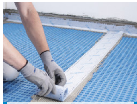
Siūlių tarp membranos lakštų hidroizoliacija su Mapeband Easy juosta, priklijuota su Mapeguard WP Adhesive klijais