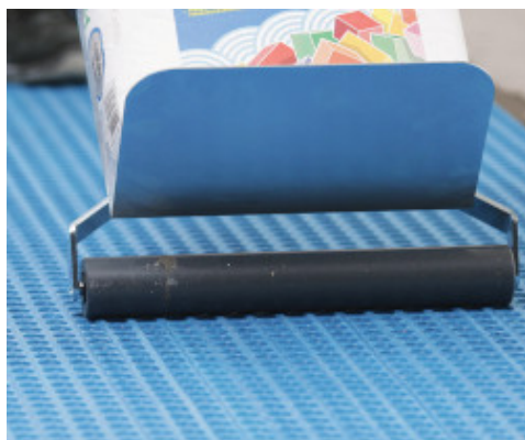
Mapeguard UM 35 membranos prispaudimas