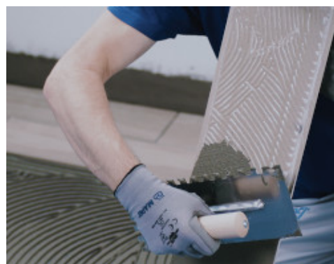
Keraminės ar akmens masės plytelės klijuojamos su atitinkamais Mapei klijais, ne žemesnės nei C2 klasės