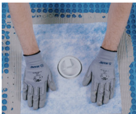
Šoninė/vertikali vamzdžių hidroizoliacija