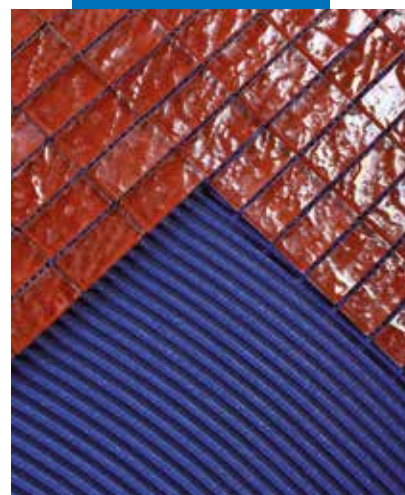
Kitą dieną mozaikos siūlės glaistomos pagal tą pačią technologiją naudojant Kerapoxy Design