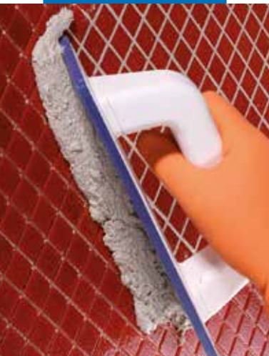
Kerapoxy Design glaisto tepimas grubią gumine mentele

Grindys yra paruoštos naudojimui praėjus 4 dienoms po darbų atlikimo (taip pat atsparios chemikalams).