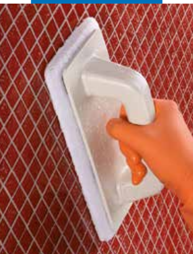
Stiklo mozaikos valymas su Scotch Brite® celiuliozine kempine