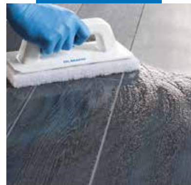
Sujungimų valymas su "Scotch-Brite" padu