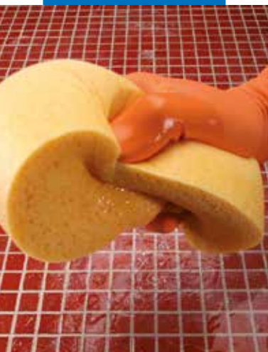
Paviršių sudrėkinimas prieš valymą