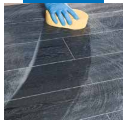
Valymo ir apdailos sujungimas su kieta celiuliozine kempine