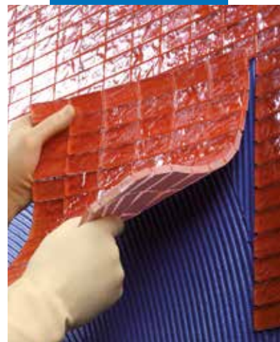
Stiklinės mozaikos klijavimas naudojant Kerapoxy Design