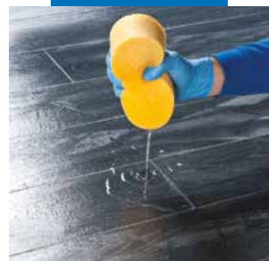
Paviršiaus drėkinimas prieš valymą